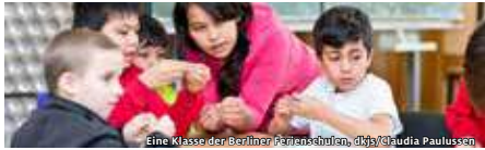
Eine Klasse der Berliner Senatschulen