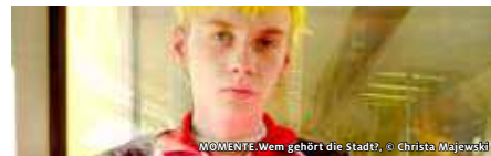
WOMENTE. Wem gehört die Stadt?