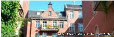
Hof der Albrechtstraße 13/14