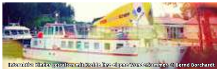
Interaktive Kinder gestalten mit Stralbe ihre eigene Wunderkammer.