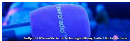
Treffpunkt WissensWerte