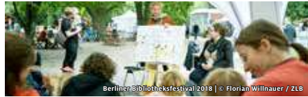
Berliner Bibliotheksfestival 2018 | © Florian Willnauer / ZLB

KONTAKT Stiftung Berliner Leben | T (030) 47 08 24 11 info@stiftung-berliner-leben.de