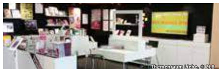
Themenraum Lisa