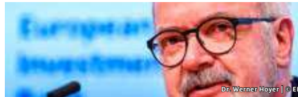
Dr. Werner Hoyer | EIB