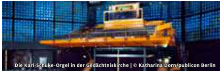
Die Karl-Schuke-Orgel in der Gedächtniskirche

STIFTUNG KAISER-WILHELM-GEDÄCHTNISKIRCHE ORGELFÜHRUNG KARL-SCHUKE-ORGEL IN DER GEDÄCHTNISKIRCHE