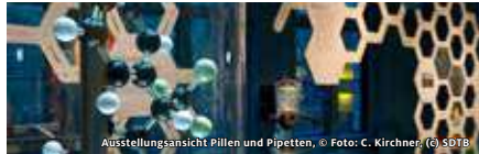
Ausstellungsansicht Pillen und Pipetten