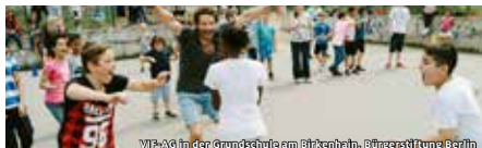
VIF-AG in der Grundschule am Birkenhain, Bürgerstiftung Berlin