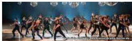
West Side Story