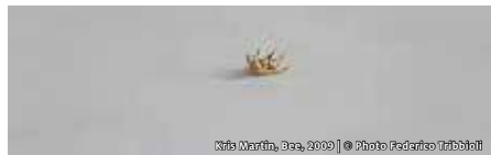
Nick Martin, Sea, 2009