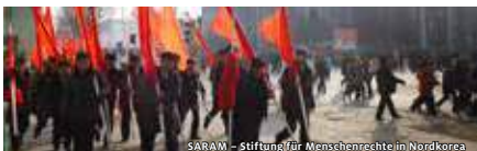
SARAM – Stiftung für Menschenrechte in Nordkorea