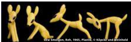
Lew Smorzon, Reh, 1965, Plastik, © Köpcke und Weinhold