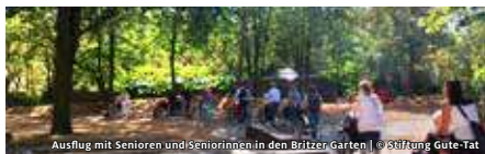
Ausflug mit Senioren und Seniorinnen in den Britzer Garten

STIFTUNG GUTE-TAT ENTWICKLUNGEN IM EHRENAMTLICHEN ENGAGEMENT EHRENAMT GESTERN, HEUTE UND MORGEN