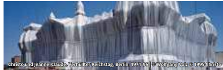
Christo und Jeanne-Claude, Verhüllter Reichstag, Berlin, 1971-93 © 1993 Christo

DEUTSCHES STIFTUNGSZENTRUM IM STIFTERVERBAND (DSZ) DER VERHÜLLTE REICHSTAG DIE DOKUMENTATIONS AUSSTELLUNG ZUM PROJEKT