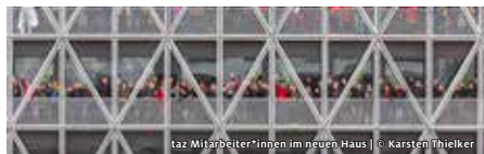
taz Mitarbeiter*innen im neuen Haus