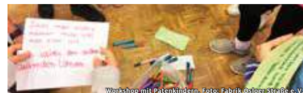
Workshop mit Patenkindern, Foto: Fabrik Osloer Straße e. V.

STIFTUNG PARITÄT BERLIN PATENSCHAFTSPROJEKTE STÄRKEN ENTWICKLUNG VON EVALUATIONS- UND BETEILIGUNGSINSTRUMENTEN