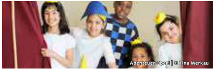
Abenteuer Oper!