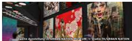
Zweite Ausstellung im URBAN NATION MUSEUM