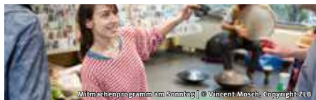
Mitmachenprogramm am Sonntag