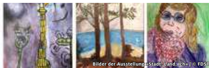
Bilder der Ausstellung »Stadt, Land, Ich«