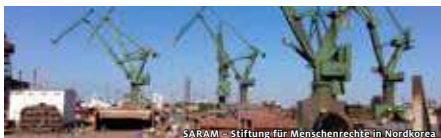
SARAM – Stiftung für Menschenrechte in Nordkorea