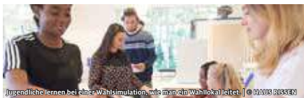
Jugendliche lernen bei einer Wahlsimulation, wie man ein Wahllokal leitet.

KREUZBERGER KINDERSTIFTUNG GEMEINNÜTZIGE AG, SCHWARZKOPF-STIFTUNG JUNGES EUROPA ERSTWAHLHELPER*INNEN BERLIN WORKSHOP ZUR EUROPAWAHL AM 26. MAI 2019