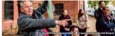
Stadtführung querstadtein