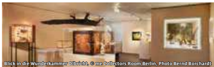
Blick in die Wunderkammer Olbricht, © me Collectors Room Berlin, Photo Bernd Borchardt