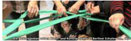
Die Kulturagenten setzen Kunst- und Kulturprojekte an Berliner Schulen um. dkjs