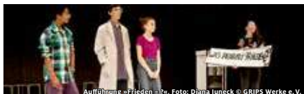
Aufführung »Frieden = ?«

STIFTUNG PARITÄT BERLIN AUF FORSCHUNGSREISE ZUM THEMA FRIEDEN THEATERSPIELKLUB VON 12- BIS 15-JÄHRIGEN