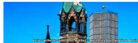
Kaiser-Wilhelm-Gedächtnis-Kirche | © Katharina Dorn/publiccon Berlin

STIFTUNG KAISER-WILHELM-GEDÄCHTNISKIRCHE, BÜRGERSTIFTUNG BERLIN SUCHT DER STADT BESTES! ABENDMAHLSGOTTESDIENST