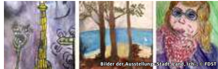
Bilder der Ausstellung »Stadt, Land, Ich«, © FDST