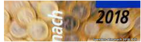
Spenden-Almanach 2018, DZI