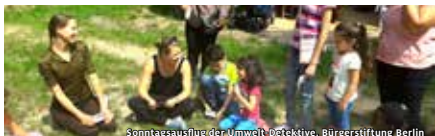
Sonntagsausflug der Umwelt-Detektive, Bürgerstiftung Berlin