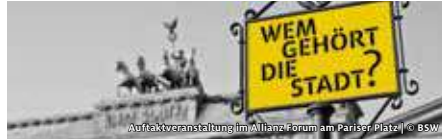
Auftaktveranstaltung im Allianz Forum am Pariser Platz