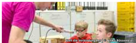
Stell die Verbindung her