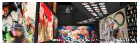
URBAN NATION MUSEUM