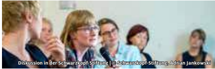
Diskussion in der Schwarzkopf-Stiftung