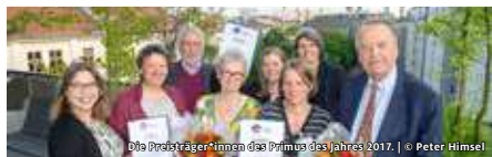
Die Preisträger:innen des Primus des Jahres 2017. | © Peter Himsel